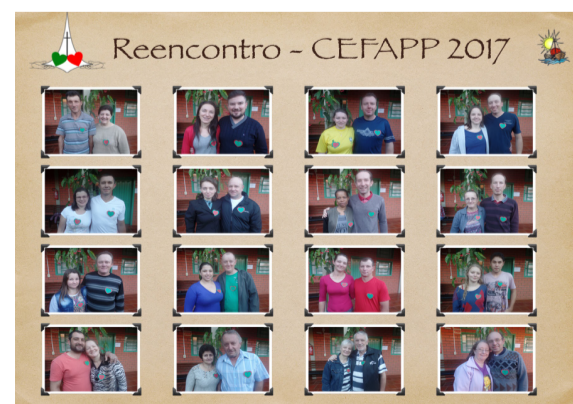
Casais que participaram do retiro