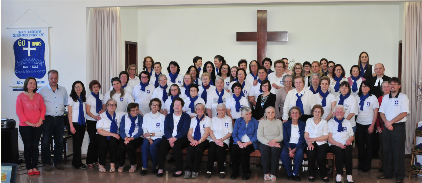
60 anos OASE Luzerna