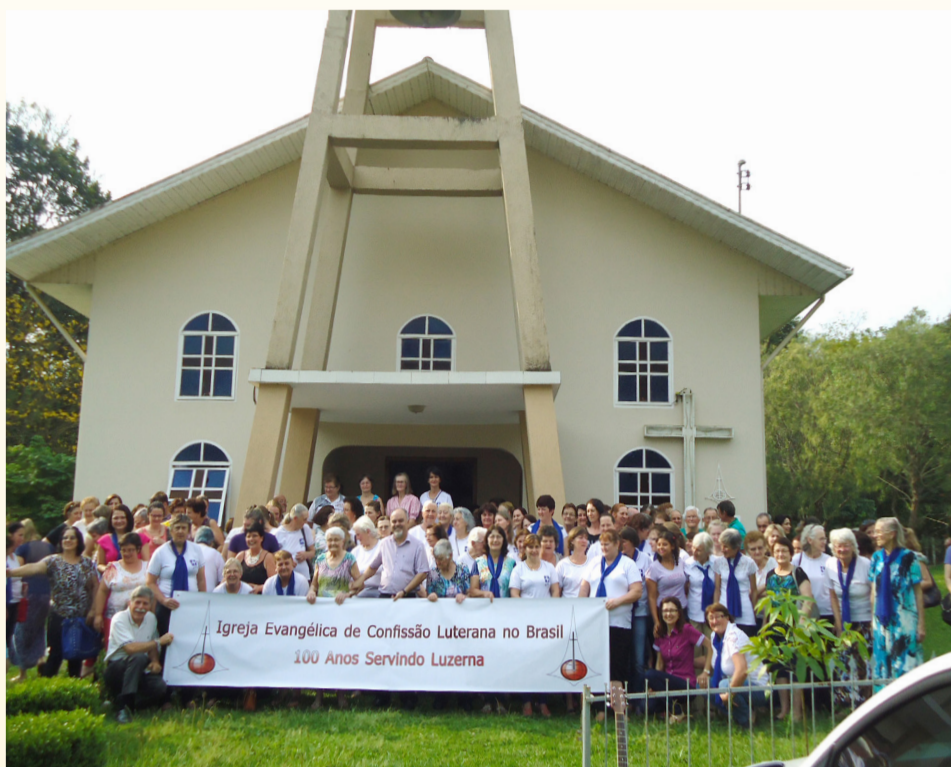
OASE Leãozinho 60 anos