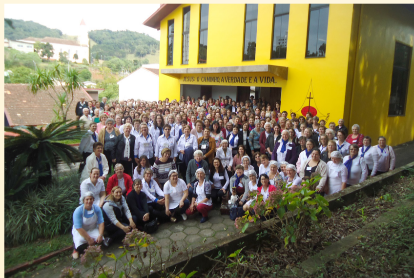
Foto núcleo rio do peixe

Pastor para 40 crianças de 3 a 6 anos, pois os pais que trabalhavam nas fábricas não tinham com quem deixar seus filhos. Este trabalho foi mantido por 20 anos até que o poder público assumiu esta responsabilidade.