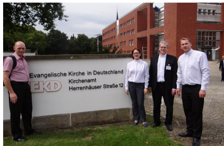
Sede da EKD em Hannover

sentou a IECLB na exposição em Wittenberg e foi responsável durante três dias pela “tenda do céu” (Himmelszelt). Neste lugar falamos com os visitantes sobre o que a IECLB faz no Brasil, cantamos, meditamos e oramos com quem ali se achegava. Também pude expor o material que o Sínodo produz para divulgar as descobertas reformatórias. Voltamos entusiasmados e ainda mais comprometidos com as descobertas reformatórias, porque agora são outros 500.