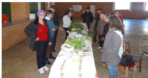
SAF N. Estrela

Mesa temos que começar a pensar no resgate, na multiplicação e no melhoramento das nossas sementes. Este ano com uma novidade levamos batata-semente para incentivar o seu cultivo.