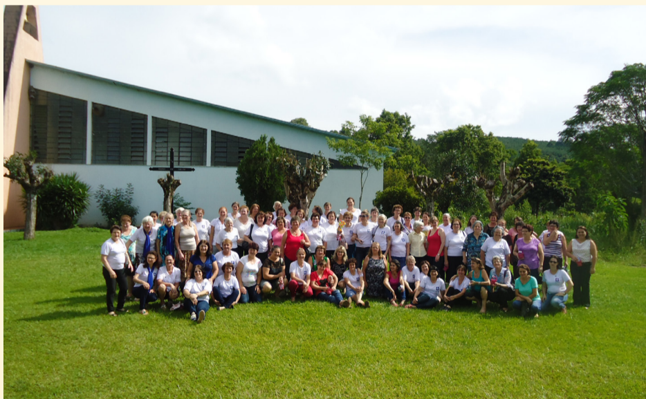
OASE Vila Kennedy