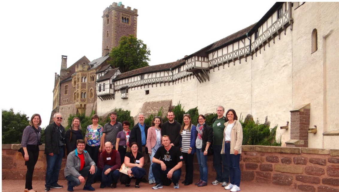
Castelo de Wartburg