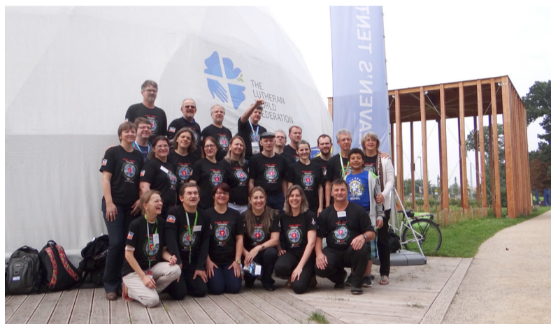
Tenda do Céu em Wittenberg