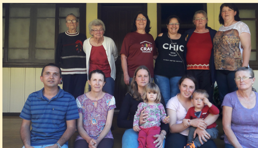
OASE - Lajeado Grande SC

aos enfermos. Para reflexão nas meditações está sendo usado o material sob o título: Trilha 8 – Descobertas na Ter-