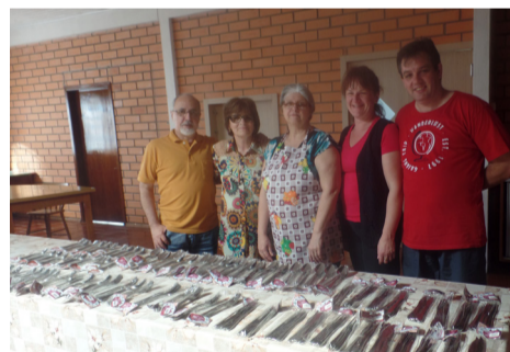
Entrega dos talheres ao CEFAPP

Nos dias 25 a 27 de agosto, foi realizado mais um Reencontro no CEFAPP em Palmitos. O encontro é organizado pelos Casais Reencontristas do Sínodo. Nesta edição, participaram 16 casais. O Reencontro é uma oportunidade que o casal tem para se reencontrar consigo, como casal e com Deus. Os momentos emocionantes que os casais vivenciam durante o encontro são marcantes para a vida deles. Diante da realidade que vivemos, as atividades dos grupos de Casais Reencontristas, no Sínodo, visam manter a família unida na fé. Além disso, o objetivo é intensificar os relacionamentos, relembrando algumas práticas que são fundamentais para uma vida conjugal plena.