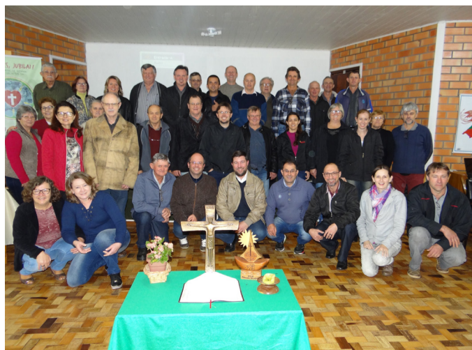
Reunião do Conselho Sinodal