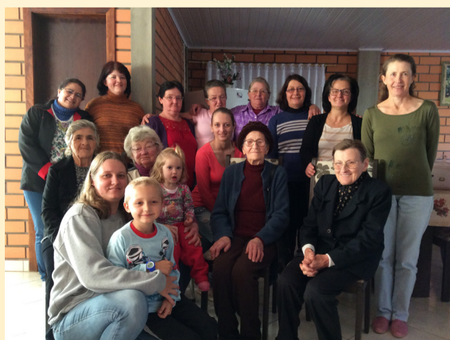
OASE - Lajeado Grande SC