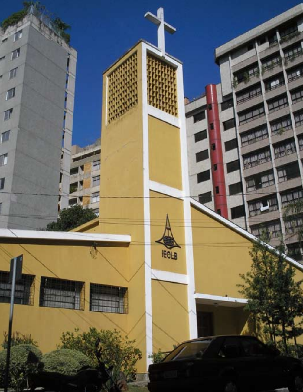
Templo de Belo Horizonte, em meio aos arranha-céus da metrópole.

Situações como a da família Sonntag se repetem em todos os ambientes urbanos. O que ela não sabe, é que o interior vai se “urbanizando” cada vez mais e importa todos os desafios da metrópole.